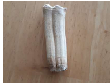
Une molaire de cheval

Seulement ce qui se trouve au dessus de mon ongle du pouce se voit en dehors de la gencive. Tout le reste est caché à l'intérieur de la gencive